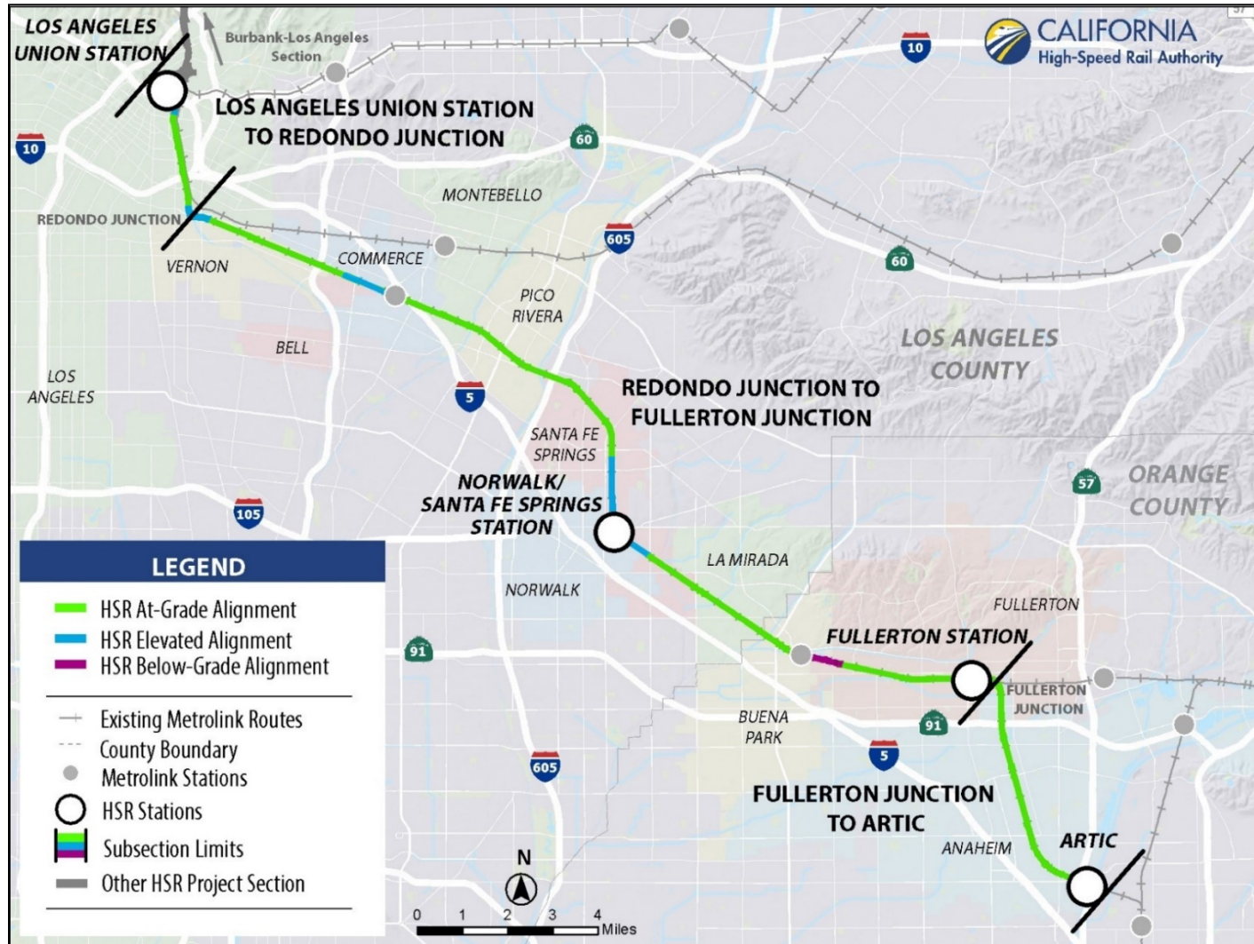
図B ロサンゼルス～アナハイム間のHSR旅客鉄道回廊路線