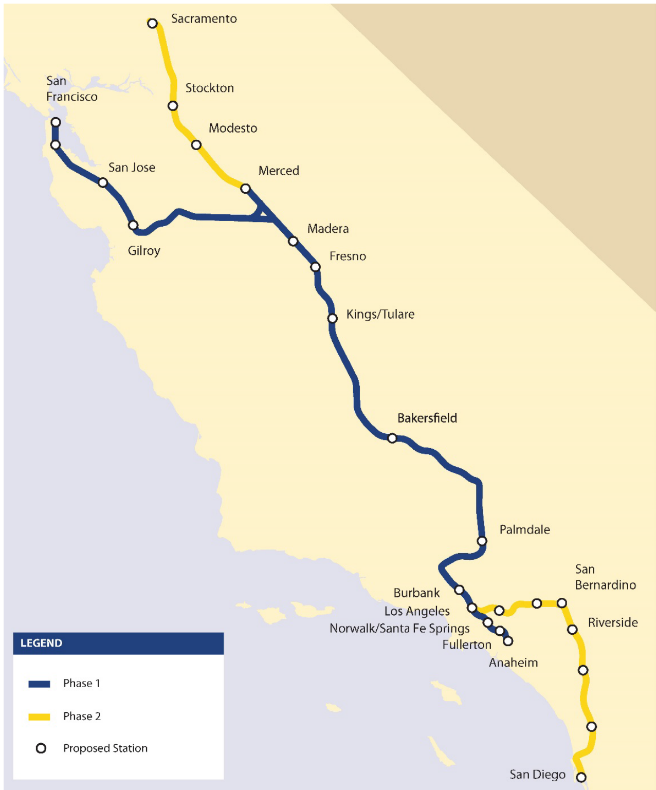
図A カリフォルニア高速鉄道システム 全州で優先される線形と駅