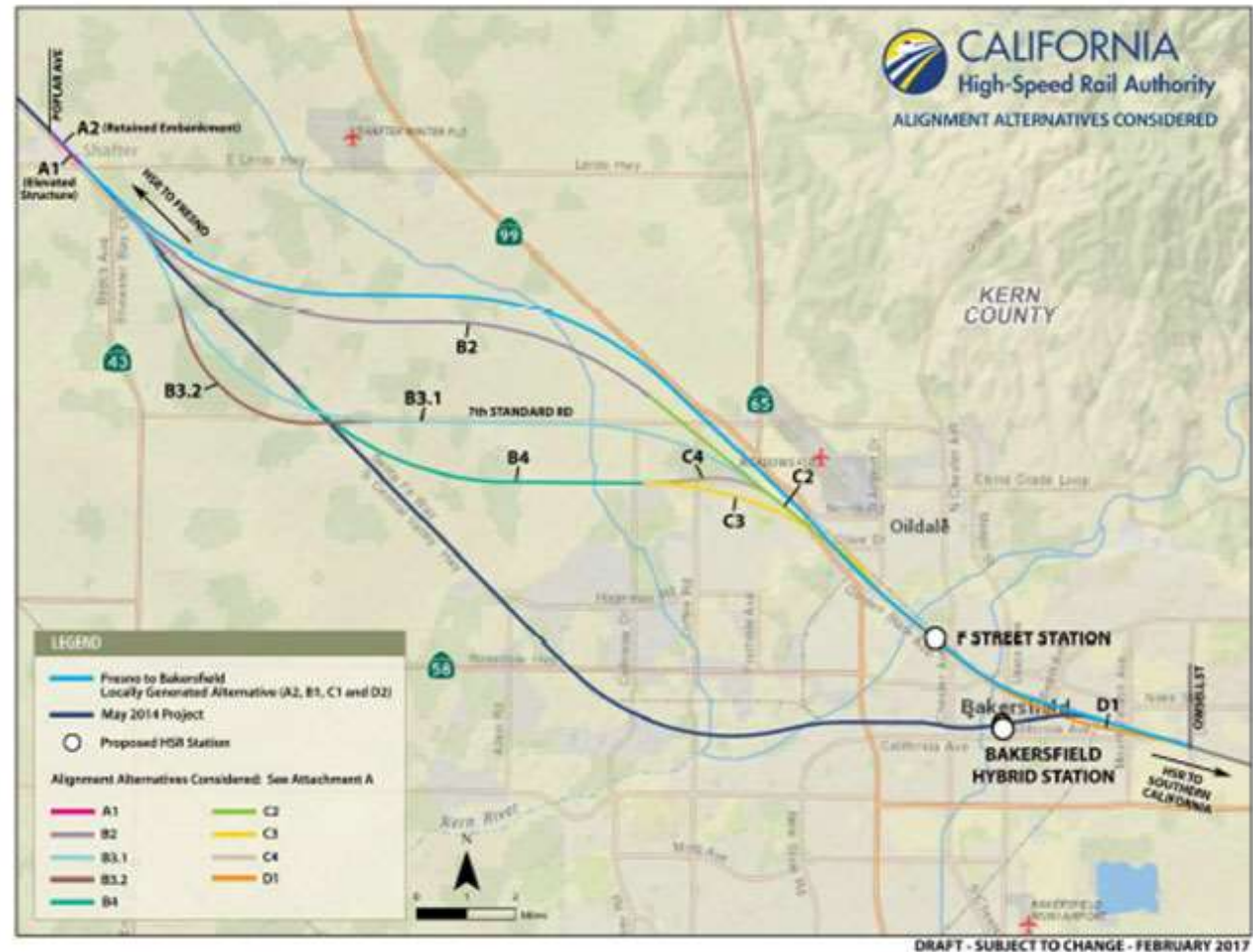
Exhibición GENERAL-01.1: Alternativas de Alineación Consideradas para la F-B LGA

F-B LGA representa una combinación de las sub-alineaciones que tienen menos impactos ambientales en comparación con las otras sub-alineaciones consideradas, puede cumplir con el propósito, la necesidad y los objetivos del proyecto, y es posible la alineación más viable y razonable.