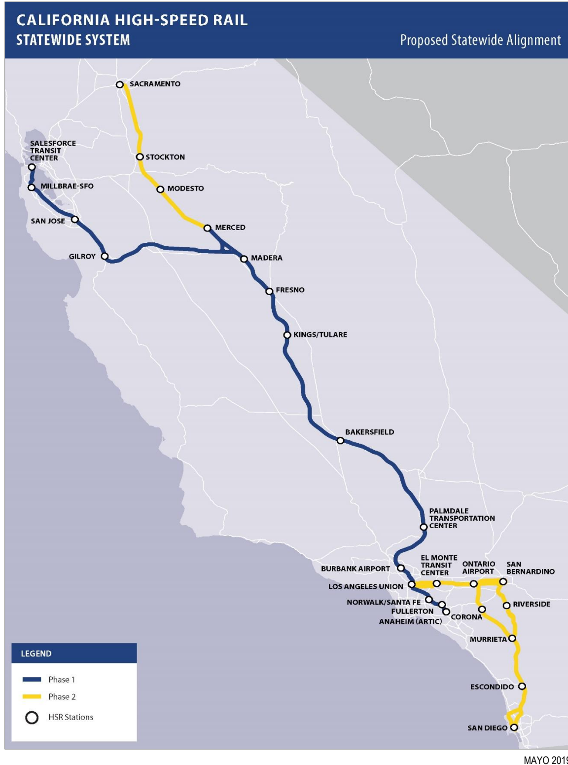
Figura S-1 Sistema ferroviario de alta velocidad de California a escala estatal